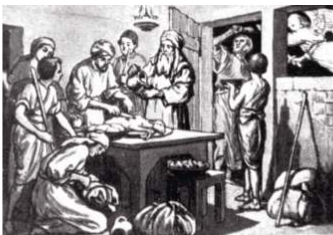
Исход евреев из Египта. Заклание агнца. Гравюра

Пасха - главный христианский праздник Светлого Воскресения Господа нашего Иисуса Христа, «праздников праздник и торжество торжеств», по слову Григория Богослова. В чем сакральный смысл этого