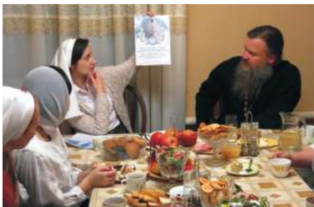
Евангельские беседы с сестрами милосердия по четвергам, 2014 г.

- Самый простой способ - остановить любую сестру в белой косыночке и задать свой вопрос. Многие так и делают. Также мой телефон или телефон социального работника можно найти на сайте нашего храма в разделе социального служения и на стендах нашего храма. Ещё хотелось бы уточнить такой момент. Многие люди подходят и просят помощи именно в медицинском уходе. Как таковыми медицинскими услугами, уходом наше сестричество пока не занимается. Мы ориентированы больше на социальное