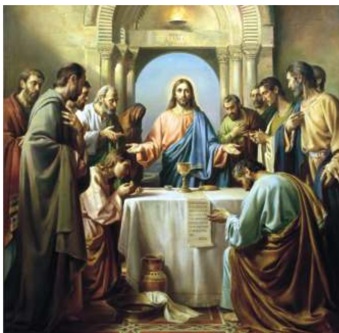
Тайная вечеря. Д.Н.Хомяков. 2009 год, Валаам

Так, праздник Воскресения Христа сохраняет даже ветхозаветное название Пасха,