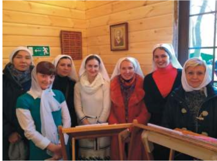
Освящение храма блж. Ксении Петербургской в Бескудниково, октябрь 2014 г.

Святой покровитель нашего храма святитель Николай особо помогал нищим. Мы тоже стараемся в своей деятельности найти тех самых нищих, убогих людей, которым порой нужна малость, но она необходима. Поэтому мы помогаем Центру социальной адаптации «Марфино», где временно проживают люди без определенного места жительства. У нас было с ними несколько встреч. Им важно, конечно, и то, что мы им приносим еду, одежду, лекарства. Но как показала практика, им, как и всем людям, нужна пища духовная. Души, которые увидели самое дно земной жизни, хоть и очерствели, но всё равно открываются навстречу Богу. Поэтому, когда к ним приходит священник, собирается очень много народу. Один раз даже удалось провести Причастие, люди сами изъявили