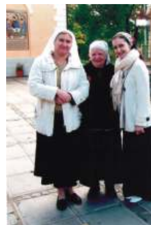
Храм свв. Космы и Дамиана, 2008 г.