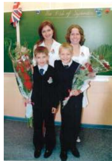
ЦСО «Локомотив», 2006 г.

- Моя главная сложность - это нагрузка. Всё приходится создавать с нуля. А направлений работы очень много, хочется максимально много сделать, но порой не хватает банально физических сил. Справляешься, естественно, только с Божией помощью. Если