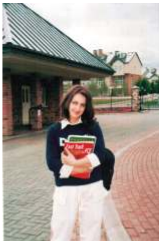
На учебе, 2005 год

- У меня педагогическое образование, по специальности я учитель английского языка. С языком свою жизнь связала не просто так, а потому, что всё детство провела в бесконечных поездках по заграницам. С детства пела в хоре «Радость», это до сих пор известный детский хор, с ним мы объехали почти весь мир, были в самых отдалённых частях света, начиная с США, заканчивая о. Тайвань.