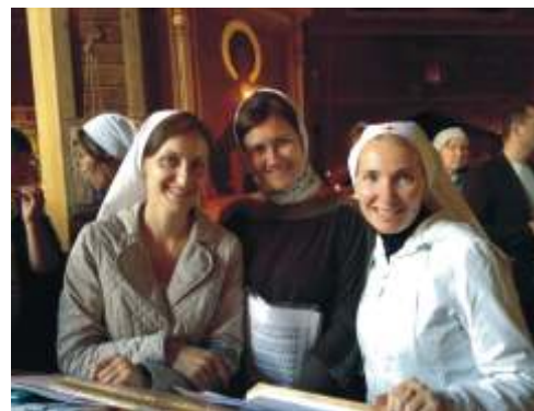
С сестрами милосердия на клиросе, храм свт. Николая, осень 2014 г.

в службе, потому что, во-первых, это требуется для пения на молебнах, панихидах, для участия в Таинствах