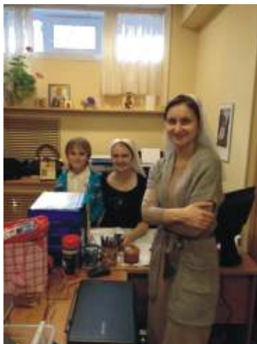
На работе, храм свт. Николая Мирликийского у Соломенной сторожки, 2014 г.

- Вы - главная сестра. Трудно ли руководить таким разным по возрасту, роду деятельности и семейному положению сестринским коллективом? Как Вы выстраиваете отношения с сестрами? И как сестры выстраивают отношения между собой?