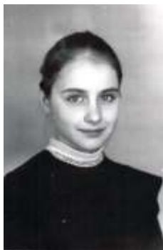
5 класс, 1993 год

головой ушла в дела милосердия. С появлением духовника моя жизнь изменилась, конечно, кардинально. Ведь духовник - это не тот человек, который за тебя все вопросы решает, а, прежде всего, тот человек, который помогает идти к Богу, точно и верно расставляет акценты и помогает в сложных ситуациях именно выбрать правильное, духовное